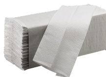
SERVIETTES EN PAPIER: FH68