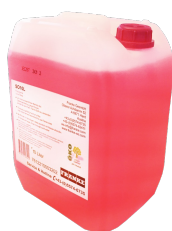
VLOEIBARE ZEEP: SO10L