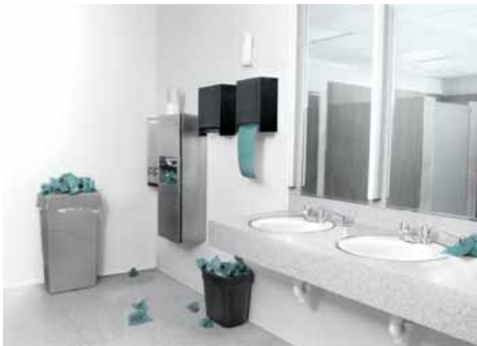
Dyson Airblade-handdrogers zijn niet alleen minder duur, maar ook duurzamer dan papieren doekjes en even hygiënisch.

Hij geeft aan dat op de ETS-website dit voorjaar een gedetailleerd plan werd gepubliceerd dat uit de doeken deed hoe - met de hulp van een publiciteitscampagne - elektrische handdrogers