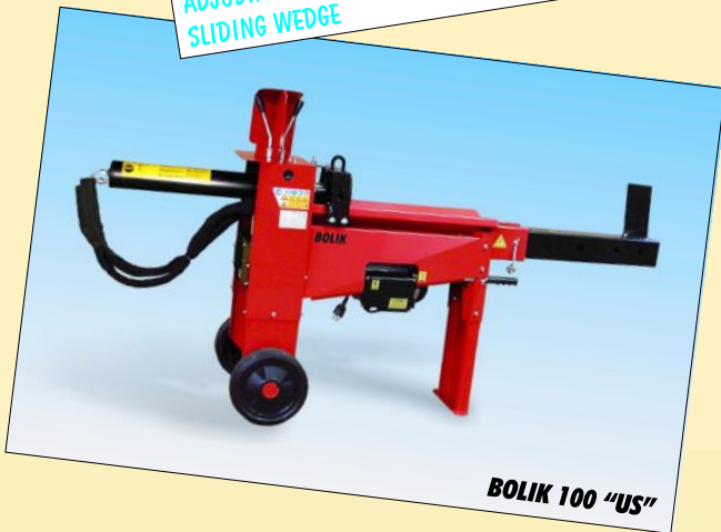
BOLIK 100 "US"

DOUBLE AUTOMATIC SPEED REDUCED SHIPPING DIMENSIONS ADJUSTABLE HIGH OF OPERATING CONTROL: ~ 104/110CM SLIDING WEDGE