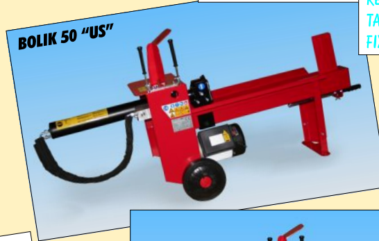
BOLIK 50 "US"

DOUBLE AUTOMATIC SPEED REDUCED SHIPPING DIMENSIONS TABLE VERSION FIXED WEDGE