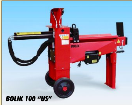
BOLIK 100 "US"

DOPPIA VELOCITÀ AUTOMATICA RIDOTTO VOLUME DI SPEDIZIONE ALTEZZA VARIABILE COMANDO DI AZIONAMENTO: ~ 104/110 CM. LAMA MOBILE