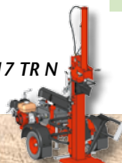
VSD 43/17 TR N